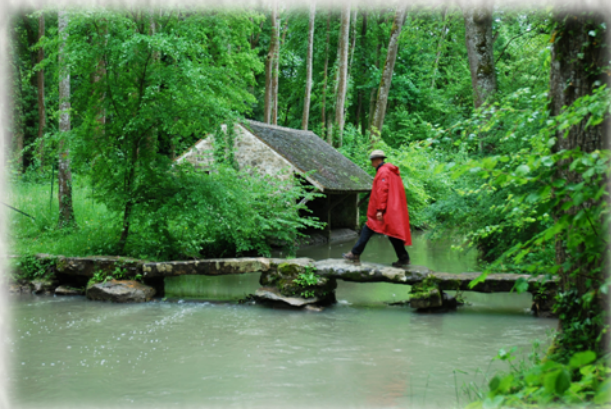
Le Pont Thierry

CODERANDO 77 Quartier Henri IV - Place d'Armes 77300 FONTAINEBLEAU