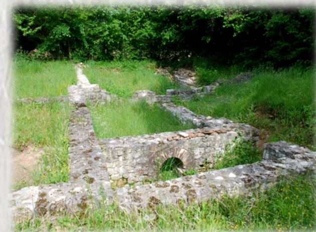
Paley : La cave aux fées

Depuis le petit bourg de Remauville, parcourez le plateau agricole avant de découvrir la charmante vallée du Lunain que jalonnent ponts, lavoirs et moulins. À Paley, vous trouverez des vestiges historiques de l'époque mérovingienne à la Révolution.