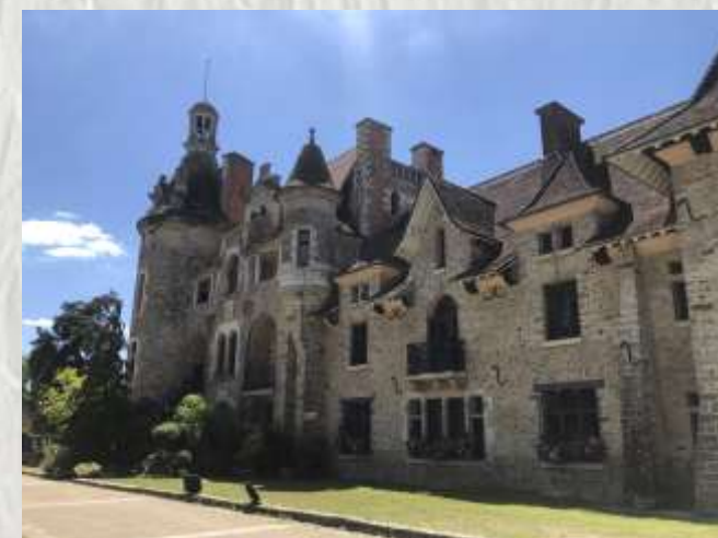
Le château des Dames

Agréable déambulation au travers le Châtelet-en-Brie, petite ville briarde dominant la source qui serait, il y a fort longtemps, la raison de son installation.