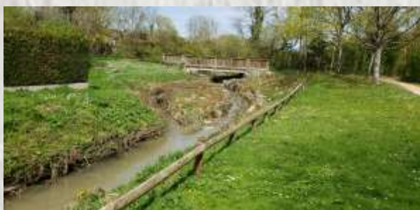
Le ru du Châtelet dans le parc Ste Reine

A partir de 1998, la commune du Chatelet-en-Brie en devint le propriétaire et le transforma en lieu culturel, après d'ultimes rénovations.