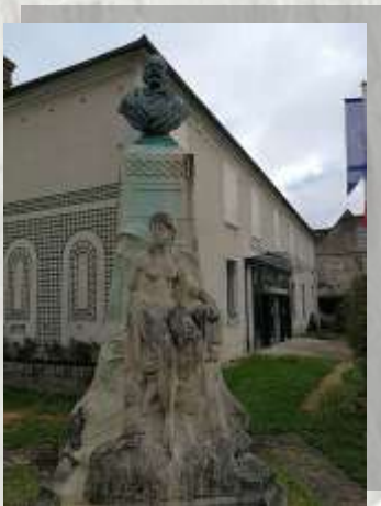
Moret-sur-Loing : Buste d'Alfred Sisley