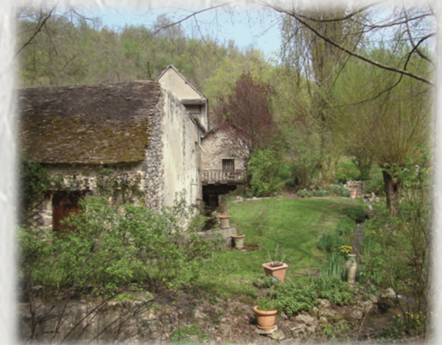
Moulin église à Vernou La Celle

Entre vergers et moulins, ce circuit visite plusieurs vallons et invite à une promenade dans le bocage. Vous découvrirez une carrière de tuf, qui permet de reconstituer le climat préhistorique de l'endroit.