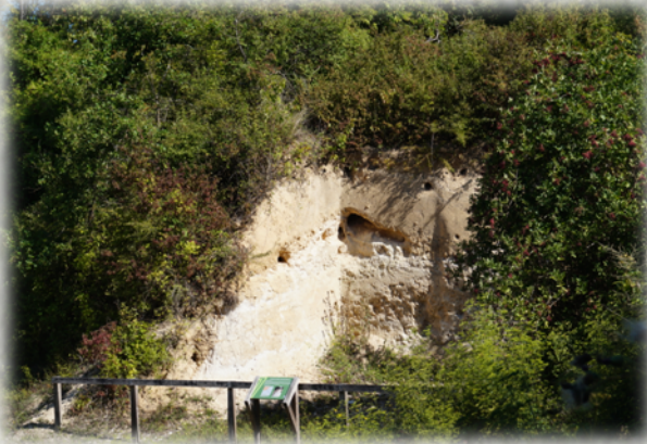
« Tuf », une roche témoin à Vernou-La Celle