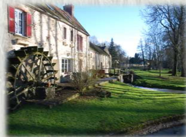
Moulin de la Vallée à Dormelles – Photo O.T ©

A partir du pittoresque village de Villecerf, parcourez les hauteurs nord et sud de la vallée de l'Orvanne et découvrez au passage les vestiges d'un grand château et un haut lieu de Résistance de la Seconde Guerre mondiale.