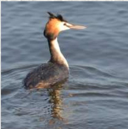
Grèbe huppé- Photo JPC ®

Quant aux différentes fermes isolées (visibles sur le parcours ou à proximité), leurs corps de bâtiments massifs entourant leur cour rectangulaire attestent de la tradition agricole briarde.