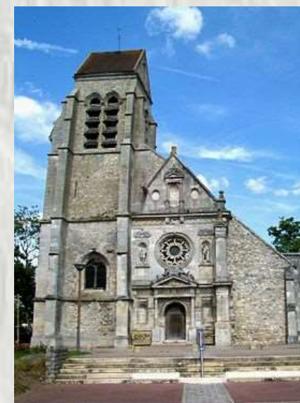
Othis : église Notre Dame

Cet itinéraire dédié à Gérard de Nerval vous transportera dans l'univers du poète ; laissez aller vos sentiments en marchant dans cette campagne vallonnée au rythme d'une tranquille promenade.