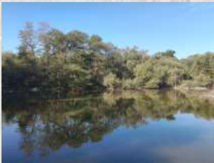
Le Parc du Pâtis

La végétation a aussi ses trésors cachés avec des plantes rares comme la Grande Naiade pour les milieux humides, l'Eupatoire chanvrine et la salicaire avec leurs multiples floraisons, ou encore des Orchidées des prairies fleuries comme l'Ophys abeille.