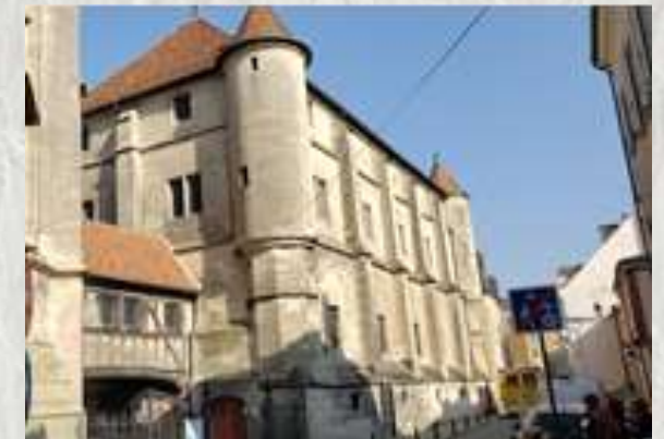
Meaux : Notre-Dame-le Chapitre

C'est une randonnée exceptionnelle qui vous attend. En hors d'œuvre, le bord de Marne, avec une belle vue sur la cathédrale. En plat de résistance, le parc du Pâtis, composé d'anciennes sablières où la nature a retrouvé ses droits, ce qui fait la joie des nombreux oiseaux qui peuplent les étangs et les tourbières. Enfin, en dessert, le vieux Meaux avec quelques belles façades et la cathédrale St-Etienne.