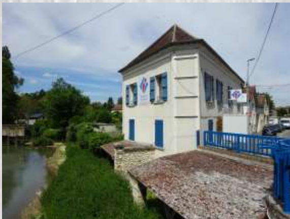
La Ferté Gaucher : Le Grand-Morin

Si le Grand Morin est une rivière habituellement paisible, propice aux balades bucoliques, à la pêche et au kayak, ses crues sont parfois redoutables. Au point d'obliger la mise en place d'actions renforcées de prévention des inondations depuis les années 2000.