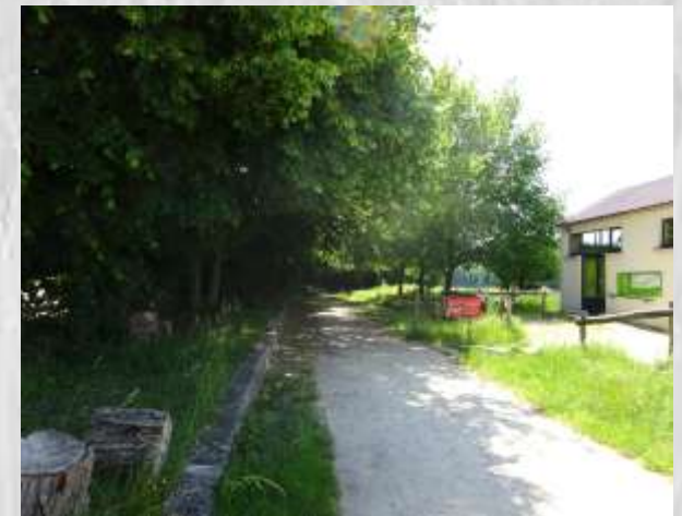
Trotignon- vélorail_ Photo CD ®

Ce circuit suit une partie du Grand-Morin, en amont de la Ferté-Gaucher. Par des boucles croisant la rivière, cet agréable itinéraire, souvent en sous-bois, vous fera passer d'un plateau dominant son cours à celui sur la rive opposée.