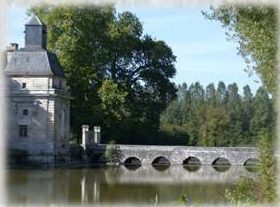
Entrée du Château de Gesvres.

Le balisage de l'itinéraire que vous empruntez est réalisé et entretenu par les 250 baliseurs du comité départemental de la Randonnée Pédestre de Seine et Marne (Codérando 77). Il fait partie des 4500 km de chemins de promenade et de randonnée existant sur le département.