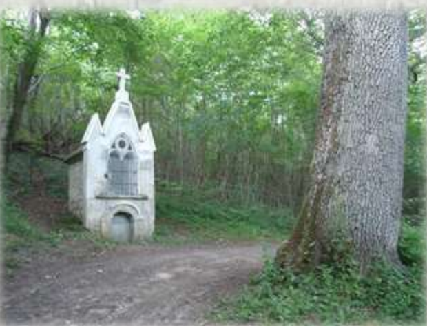
Photo : Oratoire Notre Dame du Chêne à Crouy © OT du Pays de l'Ourcq.

Vous apprécierez, grâce à ce petit parcours ombragé, toute la richesse du patrimoine et la diversité d'une nature encore préservée.