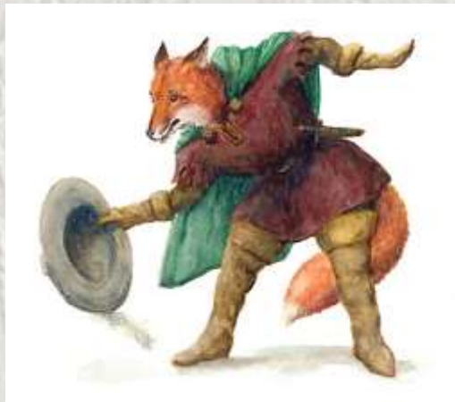
Renart le goupil

Le roman de Renart n'est pas un roman sans sens moderne, mais un ensemble disparate de récits en octosyllabes de diverses longueurs, appelés, dès le Moyen Age, des branches, regroupés par la suite en recueils. Le personnage de Renart rencontre un grand succès et il est encore vivant aujourd'hui, surtout dans la littérature enfantine. Son nom a même remplacé le terme de goupil pour désigner l'animal. « Le siège de Mauperthuis » ainsi que la forêt de Malvoisine sont cités dans un de ces recueils. Messire Renart vit à Mauperthuis. Marié à Hermeline, « la goupille », il a d'abord deux fils nommés « Percheaie » et « Malbranche ». Plus tard, viendra un troisième fils dénommé « Renardel ».