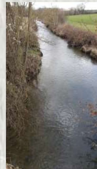
La Marsange à Ozouer le Voulgis

Vos pas vous conduiront au gré des gués. Promenade verdoyante entre bois et champs