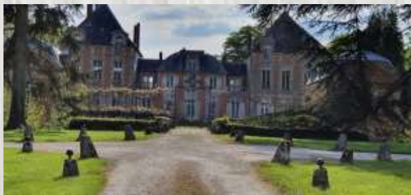
Château de Courquetaine