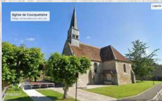
Eglise de Courquetaine

A Courquetaine (ou Ourquetaine) demeurent un château qui a partiellement survécu à la Révolution et l'église Saint-Loup, construite au XVIIe s. en remplacement d'un premier édifice religieux de style roman.