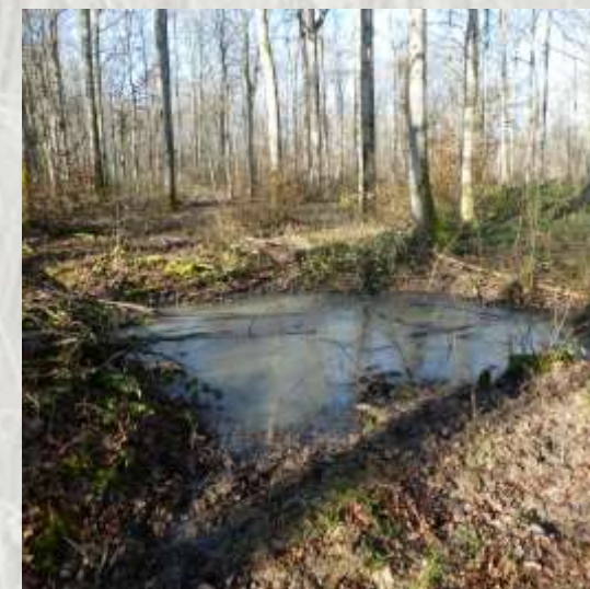
Mare près d'Echouboulain

Ce petit parcours mi-champêtre, mi forestier vous donne un aperçu des abords du massif forestier de Villefermoy, au cœur de la Brie humide, où bois et champs sont intimement imbriqués.