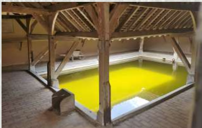
Le lavoir

Le balisage de l'itinéraire que vous empruntez est réalisé et entretenu par les 250 baliseurs du comité départemental de la Randonnée Pédestre de Seine et Marne (Codérando 77). Il fait partie des 4500 km de chemins de promenade et de randonnée existant sur le département.