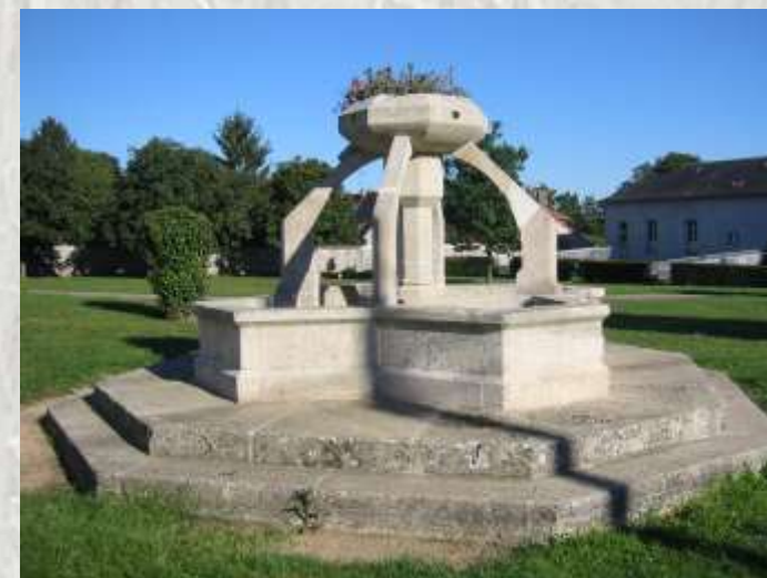
Courpalay : une Fontaine

Tout au long de votre chemin, vous pourrez admirer le lavoir de la cour Durand à Grand Bréau, le lavoir des loges et son plancher flottant, le lavoir de Fleury datant du XVIIIe siècle et le lavoir de Courpalay.