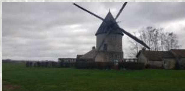
Moulins Gastins

Il fut maire peu de temps mais il exerça son influence en tant que député de Meaux (1815-1834) et conseiller général de Seine-et-Marne. Après lui, ses descendants occupèrent durant trois générations des postes de responsables politiques locaux, départementaux ou nationaux.