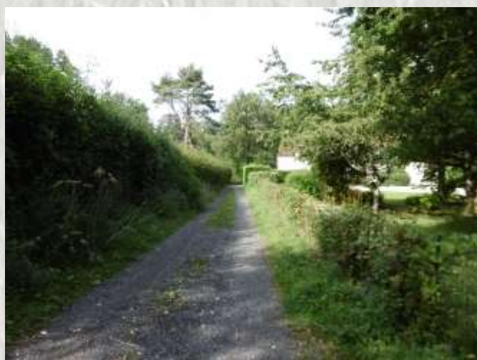
Chemin longeant le ru du Coutan à la Tuilerie Caboche

Entre le fertile plateau de Brie, la verte vallée du Grand-Morin, le vallon du ru du Coutant, bois, forêts, sources et pierres meulières abondent.