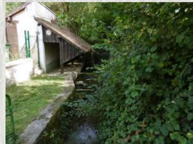
Lavoir _photo NC®