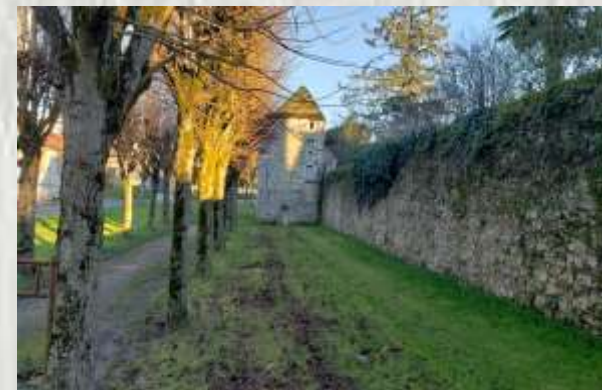
Rozay-en-Brie : les remparts

A la découverte de la cité médiévale de Rozay-en-Brie et de son patrimoine naturel