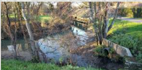
Rozay-en-Brie - Lavoir sur l'Yerres

La rivière l'Yerres, croisée à plusieurs reprises par cet itinéraire, est classée zone « Natura 2000 », c'est-à-dire zone de protection européenne pour l'environnement.