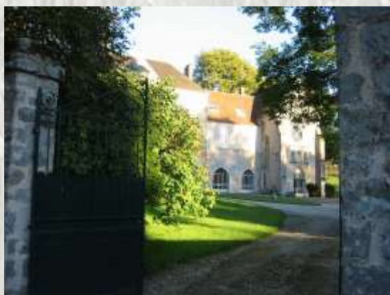
Segrès: monastère

Avec un petit détour à Courpalay, on peut visiter la brasserie Rabourdin et y suivre la fabrication de la bière de Brie. Cette fabrication commence par le maltage qui consiste à faire germer l'orge humidifié, provoquant la transformation de l'amidon des grains en sucre. Puis, pour prévenir la dégradation du sucre ainsi formé, les grains sont grillés, stoppant ainsi les mécanismes naturels de cette germination. Selon l'intensité de cette opération, du simple coup de chauffe à la torrification, la bière aura un goût et une couleur plus ou moins accentués. Le malt une fois broyé est brassé dans l'eau chaude pour obtenir un jus sucré appelé moût. A ce moût sont ajoutées des fleurs séchées de houblon pour l'aseptiser partiellement et lui conférer des arômes et de l'amertume. Après refroidissement, des levures sont additionnées qui transformeront le sucre en alcool, libérant du gaz carbonique à l'origine de l'effervescence du liquide, tout en y apportant des goûts spécifiques. Différentes céréales et des produits sucrés peuvent être ajoutées à l'orge pour des questions économiques ou de goût, tout comme les levures utilisées sont sélectionnées en vue de donner les caractéristiques particulières (aspect, goût, mousse, ...) à la bière obtenue."