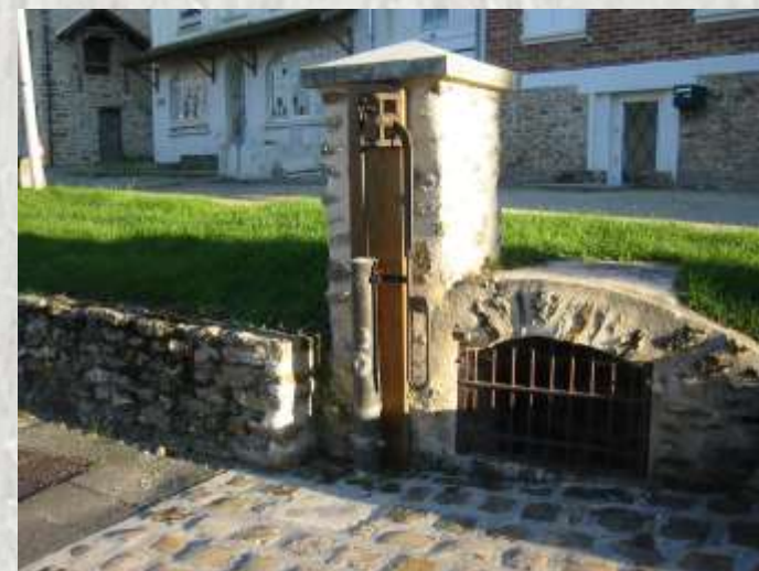
Bernay : une pompe

L'Yerres est une rivière capricieuse que l'on arrive parfois à franchir par des gués, mais qui, en période pluvieuse, peut déborder puis s'étendre largement, au point que peu de village se sont installés près de ses rives.