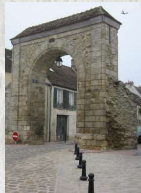
Fontenay-Trésigny : la porte d'en bas

Chemin faisant, découvrons le Fontenay d'hier et d'aujourd'hui.