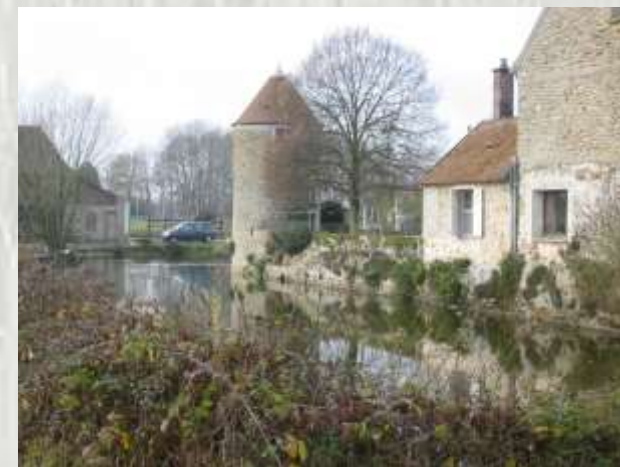
Neufmoutiers : Ferme Egrefin

Un circuit facile et plaisant, accessible aux enfants, à la découverte de la faune et de la flore locale.