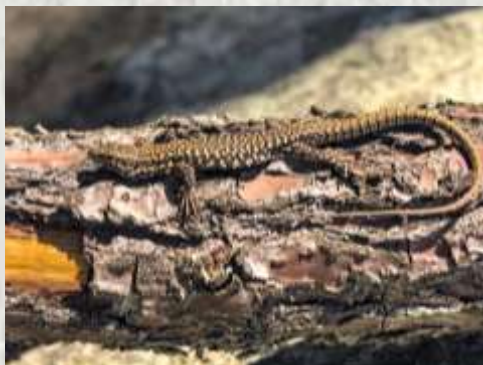
Le lézard des forêts