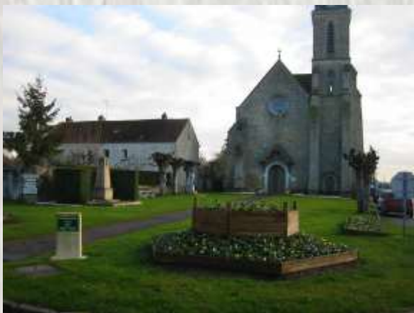
L'église de Neufmoutiers