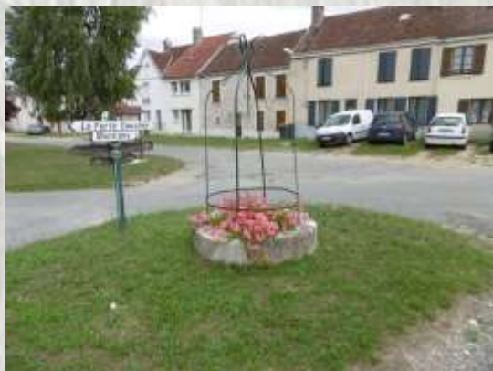
Puit fleuri sur la placette du hameau de la Chair aux gens

Un gaille est, en vieux patois, un cheval.