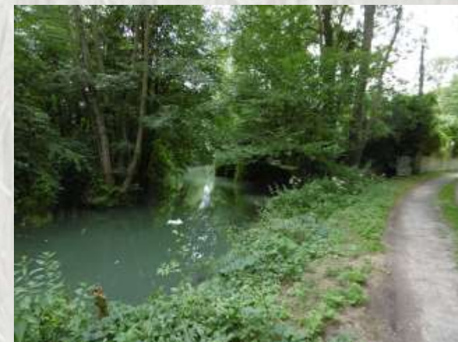
Le Morin avant le Chemin des Gailles

Artistes et écoliers se rappellent du papier Velin du Marais. La papeterie du Marais, sur le Grand-Morin, fabriquait aussi les assignats de la Révolution et les billets de la Banque de France.