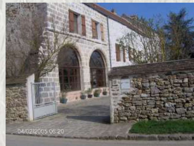
Le Plessis : l'ancien monastère

A la découverte d'un village culturel Autour de la vallée de l'Yerres.