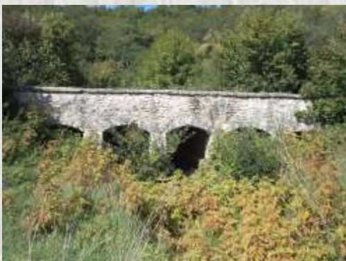
Le pont Vallerand

Le balisage de l'itinéraire que vous empruntez est réalisé et entretenu par les 250 baliseurs du comité départemental de la Randonnée Pédestre de Seine et Marne (Codérando 77). Il fait partie des 4500 km de chemins de promenade et de randonnée existant sur le département.