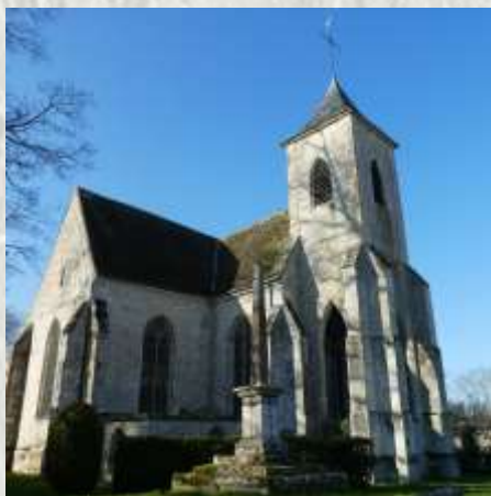
Eglise de Féricy

Le culte de Sainte Osmane fut introduit à Ferriciacus dit aussi Ferriciacus, à l'époque des premiers rois carolingiens (VIII e et IX e s.) lorsque le roi attribua ces terres à l'abbaye de Saint-Denis. L'église, édifiée aux XI e et XII e s., reçut des reliques supposées de la sainte en 1405. Des pouvoirs de guérison et de fécondité furent également attribués à la source éponyme toute proche. Anne d'Autriche, mère de Louis XIV, puis Marie-Thérèse d'Autriche, l'épouse de ce dernier, y eurent recours. Dès lors, les pèlerinages à la source Sainte Osmane se multiplièrent tout en restant essentiellement régionaux (Fontainebleau et environs).