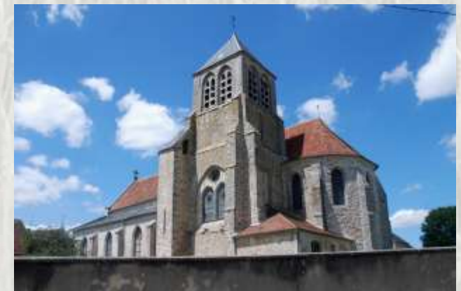
Saints : l'église

La commune de Saints vous invite à parcourir ses sentiers : vous y découvrirez les anciens moulins alimentés par l'Aubetin, plusieurs châteaux, des croix de chemins et de nombreuses sources.