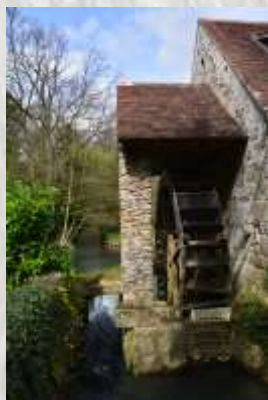
Moulin de Laval