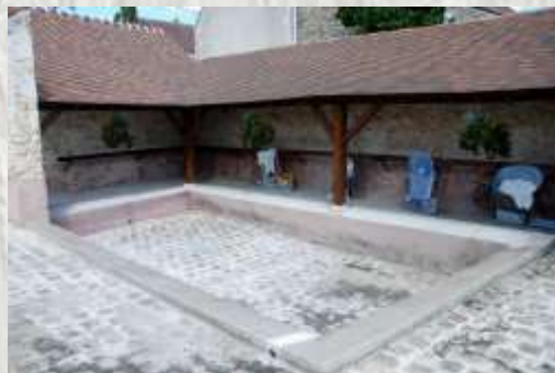
Saints : le lavoir