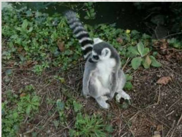
Parc des félins-Lemur catta_Nesles_

Situé sur la commune de Lumigny-Nesles-Ormeaux, le Parc est un centre d'élevage et de reproduction principalement consacré à la famille des félins. Il est unique par le nombre d'espèces qui s'y trouvent : plus de 25 sur les 36 vivant sur la planète. Des plus petits, comme le chat des sables, au plus gros tels que tigres, panthères et lions, les 140 félins qui y vivent sont répartis dans de vastes enclos regroupés en fonction des continents : Europe, Asie, Afrique, et Amérique. Quant au concept du parc et aux attractions qu'il propose, leur originalité en font un lieu de découverte sans équivalent.