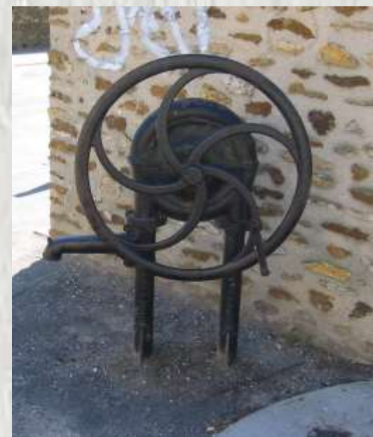
Les Ormeaux : une pompe

Trois villages avec leur église, leur mairie, leur cimetière et leur identité historique fondus en une seule commune.