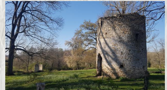
Domaine d'aiguillon

Le cours d'eau dont cet itinéraire bucolique vous fait parcourir de part et d'autre le vallon porte un nom source de confusion : le ru d'Ancoeur. Un peu avant Blandy-les-Tours, il se nomme l'Ancoeur puis, après la traversée du parc de Vaux-le-Vicomte, l'Almont.