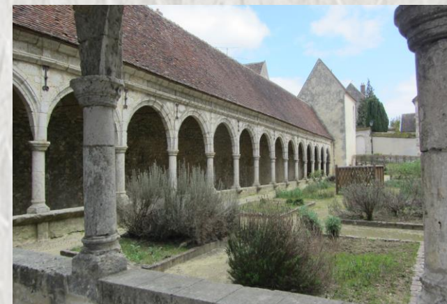
Cloître de l'église de Donnemarie-Dontilly

Au sud Ouest de Provins, le vallon de l'Auxence traverse le terroir du Montois. Deux tours et une porte, un jardin médiéval, une magnifique église et son cloître évoquent les grandeurs passées de Donnemarie.