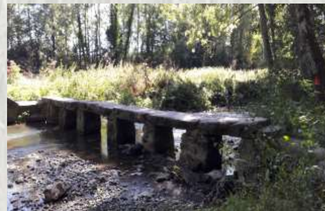
Maincy : pont de pierre sur l'Almont

Ce parcours tranquille sillonne la vallée de l'Almont, entre le château de Vaux-le-Vicomte et la ville de Melun. Bois, rivière et rus l'agrémentent, au point qu'un peintre réputé en a immortalisé l'un des sites.