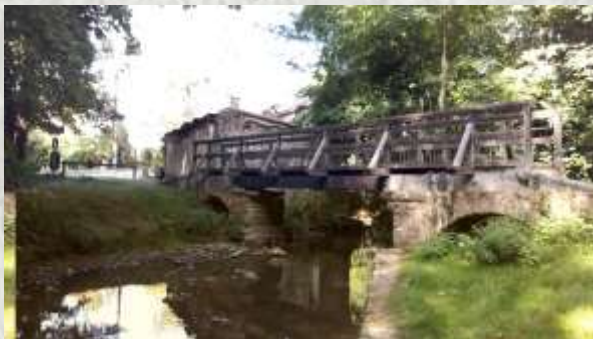
Maincy : Pont Cézanne

Le pont de Maincy, rendu célèbre par le peintre Cézanne (1839-1906), est situé dans le bas de Trois Moulins, il franchit l'Almont, marquant la limite des communes de Maincy et Melun. Paul Cézanne a peint cet endroit alors qu'il séjournait à Melun en 1879. L'œuvre est importante car elle marque un tournant décisif dans l'expression de l'artiste qui rompt avec l'impressionnisme. Elle est aujourd'hui exposée au musée d'Orsay. Ce n'est qu'en 1950 qu'un professeur de dessin reconnaît le lieu et intervient pour que ce tableau retrouve son vrai nom : « Pont de Maincy » nommé auparavant « Pont de Mennecy » en raison probablement de l'accent méridional de son auteur.