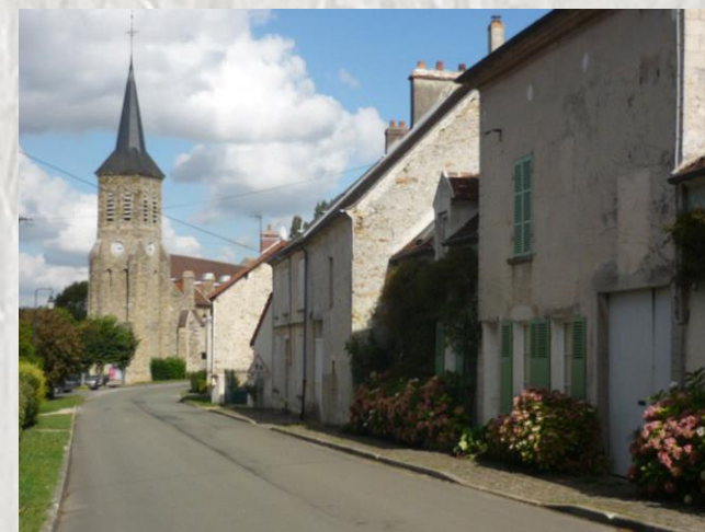
Saint Denis Bourg – Raboireau

Cette promenade va vous permettre de parcourir, en hauteur, le vallon du Raboireau jusqu'à la vallée du Grand-Morin et de retrouver St-Denis-lès-Rebais par grands espaces briards.