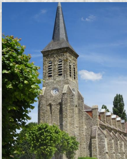
Eglise de Saint-Denis-Les-Rebais

A noter un édifice peu courant dans la région : un temple protestant a été bâti en 1858 dans le hameau de Mazagran distant de 1 km 5 à l'ouest de St-Denis-lès-Rebais.