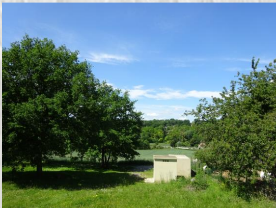
Le vallon du Raboireau à St-Denis-les-Rebais

Le balisage de l'itinéraire que vous empruntez est réalisé et entretenu par les 250 baliseurs du comité départemental de la Randonnée Pédestre de Seine et Marne (Codérand 77). Il fait partie des 4500 km de chemins de promenade et de randonnée existant sur le département.