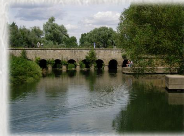
Le pont canal

Un ouvrage d'art remarquable : le pont-canal à Condé-Ste-Libiaire et la cathédrale de Meaux vous surprendront au long de ce parcours.