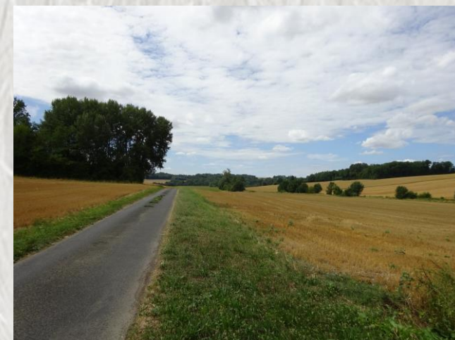
La Bretonnière

Cette deuxième promenade axée sur le ru du Raboireau vous permettra de parcourir les 2 versants du vallon en parcourant au passage plusieurs hameaux du pays de Rebais.