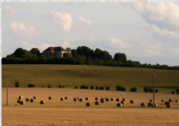
La butte de Doue