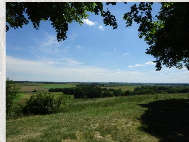
Doue – Photo CD ©

Une randonnée originale qui vous conduira à travers champs du site exceptionnel de la butte de Doue au bois de Doue