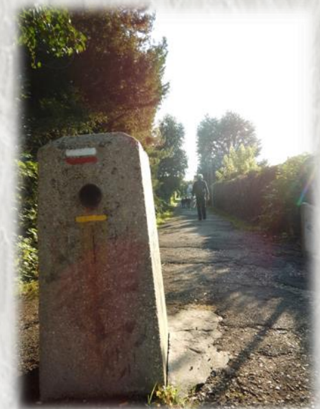
Veneux : Les venelles

Laissez-vous guider dans ce labyrinthe de venelles qui vous fera découvrir Veneux-les-Sablons comme vous ne pensiez pas le voir.