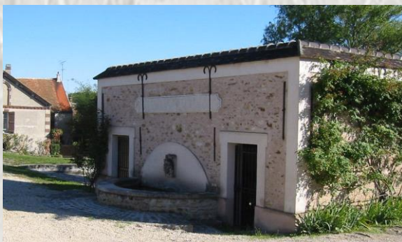
La Chapelle-Iger : Chapelle et lavoir

Il faut voir également sur la commune le moulin de Choix. Il date du XIX ème siècle et possède des ailes de type Berton : est un des premiers modèles à crémaillères. Ce système permet, avec ses ailes composées de planches de bois coulissantes, de régler la surface déployée de l'intérieur du moulin en fonction de la force du vent.