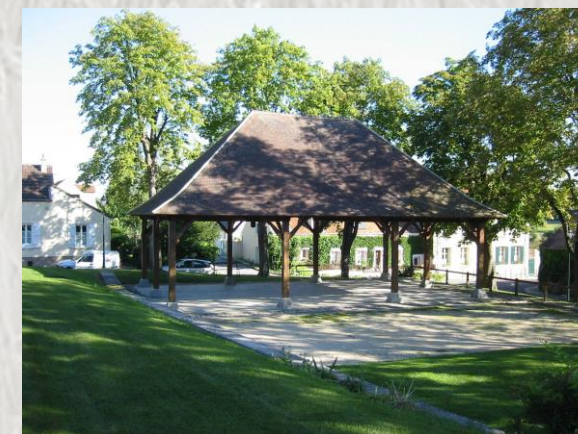
La Chapelle Iger : la halle

Cette randonnée vous fera découvrir des sites peu connus de Seine-et-Marne : le village de La Chapelle-Iger, les vallons des rus d'Yvron et de Vallières, avec en prime un moulin à vent restauré et remis au vent..