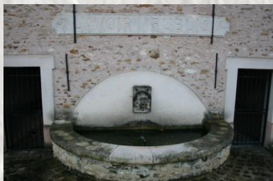
La Chapelle-Iger : la fontaine du lavoir