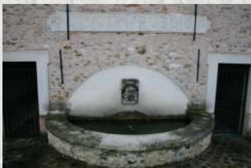
La Chapelle-Iger : la fontaine du lavoir

Le balisage de l'itinéraire que vous empruntez est réalisé et entretenu par les 300 baliseurs du Comité Départemental de la Randonnée Pédestre de Seine et Marne (Codérando 77). Il fait partie des 4 900 km de chemins de promenade et de randonnée existant sur le département.