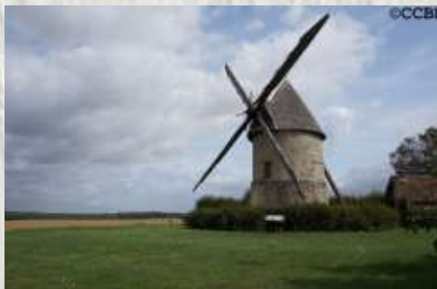
Moulin Choix - Gastins

Seul moulin en France à avoir conservé ce mécanisme, il a été classé Monument Historique (y compris son mécanisme) en 1970.