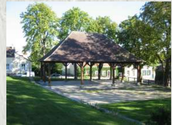
La Chapelle-Iger : la halle

Cette randonnée vous fera découvrir des sites peu connus de Seine-et-Marne : le village de La Chapelle-Iger, les vallons des rus d'Yvron et de Vallières, avec en prime un moulin à vent restauré et remis au vent.