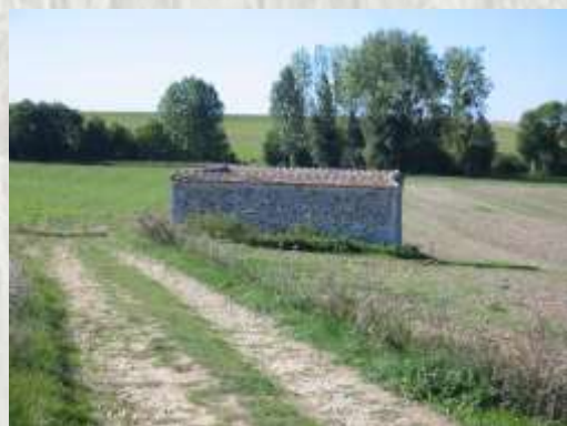
Le lavoir au Plessis

Ont résidé au village, le claveciniste Jacques Champion de Chambonnières (1601-1672), ami des Couperin qu'il introduira à la cour de Louis XIV, ainsi que Jean Commère (1920-1986), peintre coloriste et dessinateur virtuose, dont certaines œuvres sont inspirées des paysages briards.