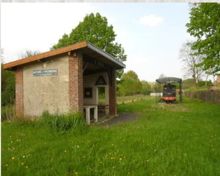
La halte de St-Ouen-sur-Morin aujourd'hui.