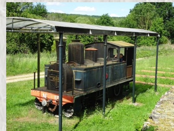
Saint Ouen sur Morin - Le tacot

Cette petite randonnée de 6 km, une balade en somme, vous fera parcourir les différents hameaux de St-Ouen-sur-Morin. La localité est connue depuis le 12ème siècle : que d'histoires vécues en 800 ans !