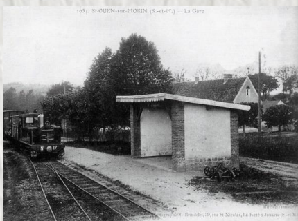
La halte de St-Ouen-sur-Morin jadis.

La ligne de la Ferté-sous-Jouarre à Montmirail appelé le Tacot est une ligne de chemin de fer secondaire à voie métrique de 45 km, aujourd'hui disparue. Elle était concédée à la compagnie de chemins de fer départementaux (CFD) et reliait ces deux villes par la vallée du Petit Morin de son ouverture en 1889, à sa fermeture en 1947.