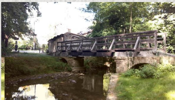
Maincy : Pont Cézanne

Le pont de Maincy, rendu célèbre par le peintre Cézanne (1839-1906), est situé dans le bas de Trois Moulins, il franchit l'Almont, marquant la limite des communes de Maincy et Melun. Paul Cézanne a peint cet endroit alors qu'il séjournait à Melun en 1879. L'œuvre est importante car elle marque un tournant décisif dans l'expression de l'artiste qui rompt avec l'impressionnisme. Elle est aujourd'hui exposée au musée d'Orsay. Ce n'est qu'en 1950 qu'un professeur de dessin reconnaît le lieu et intervient pour que ce tableau retrouve son vrai nom : « Pont de Maincy » nommé auparavant « Pont de Menecy » en raison probablement de l'accent méridional de son auteur.