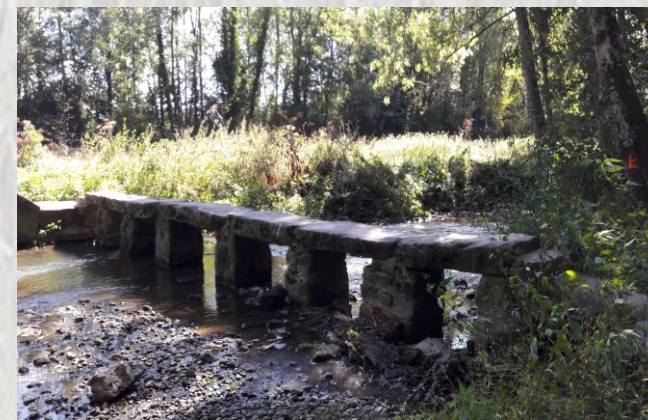
Maincy : un petit pont

Ce parcours tranquille sillonne la vallée de L'Almont, entre le château de Vaux-le-Vicomte et la ville de Melun. Bois, rivière et rus l'agrémentent, au point qu'un peintre réputé en a immortalisé l'un des sites.