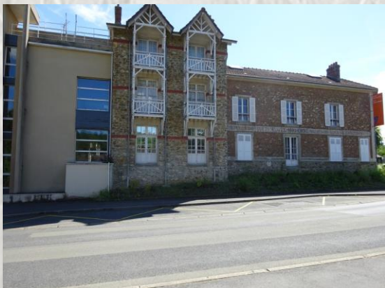
Saint Cyr sur Morin : Le Musée

A Saint-Cyr-sur-Morin, le musée départemental des Pays de Seine-et-Marne présente la vie traditionnelle du nord-est de la Seine-et-Marne. Une exposition permanente évoque les travaux des champs, l'élevage, les costumes traditionnels, l'artisanat et l'habitat rural et la région. Une nouvelle salle présente les souvenirs de Pierre Mac-Orlan (1882-1970) qui vécut 46 années à Saint-Cyr. Surnommé « écrivain du fantastique social », sa maison est une ancienne petite ferme (typique du plateau briard) à la sortie du village. Il reçut ses amis montmartrois du Lapin Agile et de L'auberge de l'œuf dur, avec de nombreux artistes de l'entre-deux-guerres. Le film Quai des brumes et des chansons de Juliette Gréco avaient trouvé leur auteur.