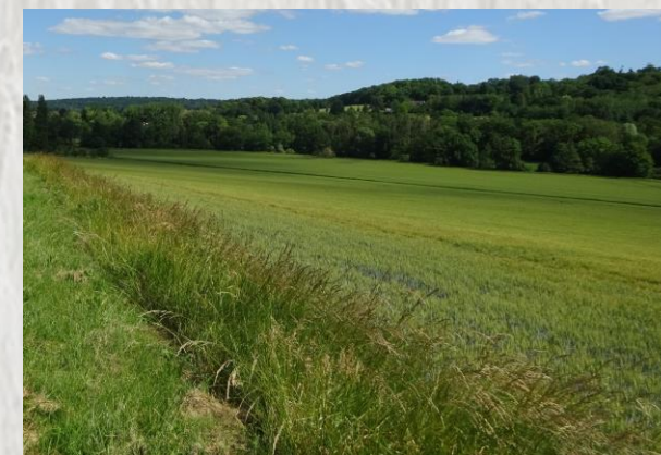
Saint Cyr sur Morin : Photo CD ®

Une maison claire, petite « bricole » du pays, recouverte de lierre : c'est la maison de Pierre Marc Orlan. Un musée des Pays-de-Seine-et-Marne et une cour de ferme colorée marquent la balade du Petit-Morin.