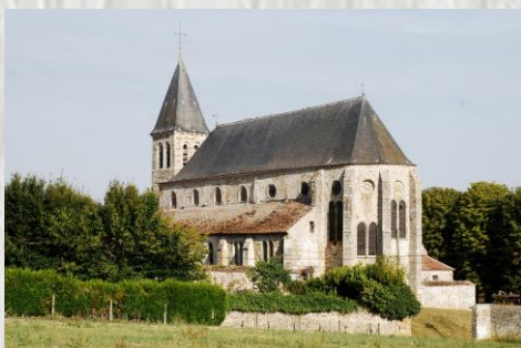
L'église de Dontilly : Photo OT ©

L'abbaye de Preuilly : En 1118 Thibaut, comte de Champagne, concède la terre de Preuilly aux Cisterciens. L'abbé Arthaud et douze moines fondent Notre-Dame de Preuilly, 5e fille de Cîteaux. Frappé par les guerres, le site subit quelques destructions puis, après la Révolution, l'église est transformée en atelier pour la fabrication du salpêtre et les bâtiments sont vendus par lots. En 1866, le domaine est réuni et devient une exploitation agricole, aujourd'hui propriété privée.