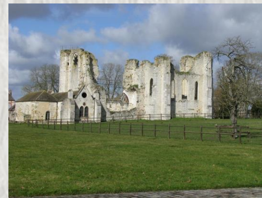
L'ancienne abbaye de Preuilly

Parcourez un circuit historique riche de remarquables édifices religieux et civils dans un cadre champêtre, à travers les collines et les vallons des petits affluents de la rive droite de la Seine.