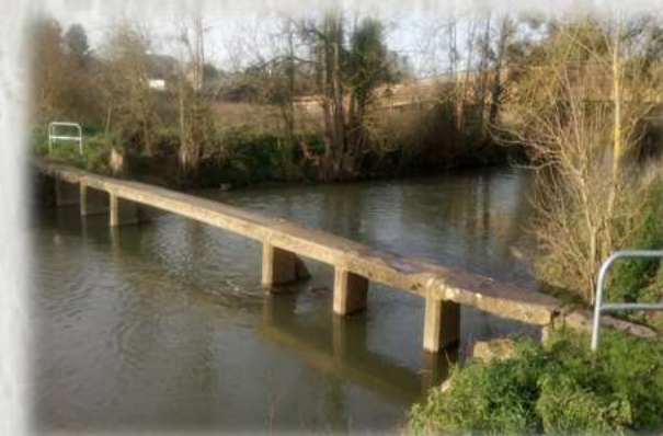
L'Yerres- ancien pont d'une seule dalle (perré) doublant un gué

L'Yerres est certainement l'une des rares rivières de France à se traverser encore à gué. Une expérience surprenante à réaliser. Préférez-vous le pont ou marcher légèrement dans l'eau ?