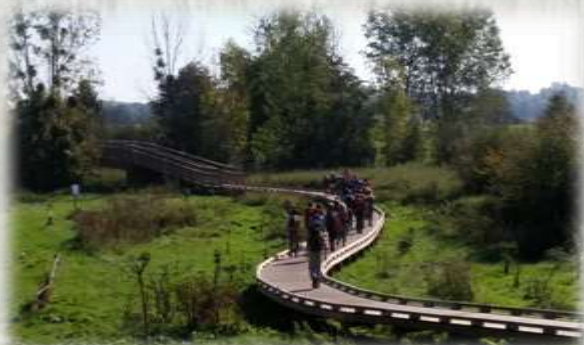
Soignolles : nouvelle passerelle sur l'Yerres