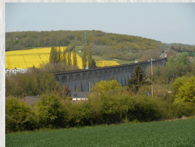
Vu sur le viaduc de Longueville

Ce vallon aux paysages vallonnés et variés, prés, cultures, et bois s'étire entre deux villages : Longueville et Chalautre la Petite. Il est parcouru par le charmant ruisseau des Méances. Cette randonnée champêtre et bucolique saura vous séduire et vous apportera la sérénité.