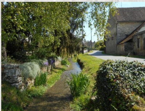
Le ru des Méances à Chalautre la Petite

A voir dans le village traversé par le ru des Méances : l'église St-Martin des 12 e et 13 e siècles qui possède un retable en pierre du 16 e illustrant la Cène, le mausolée de Guillaume Chalostre, un des premiers seigneurs de la paroisse, la maison de l'escargot du 16 e siècle, ancienne demeure seigneuriale fortifiée qui a aussi abrité le cellier du prieuré-cure de Chalautre.