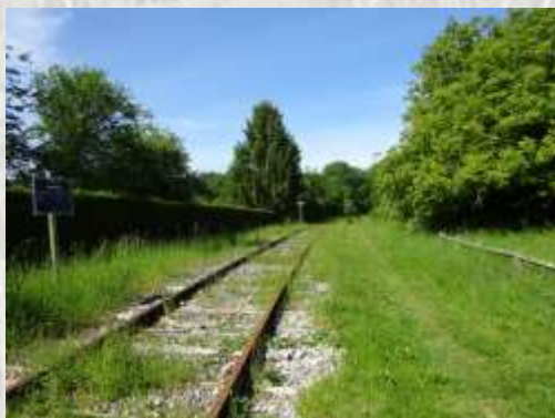
Cormeaux : le Vélo Rail

Pour relier, par le train, Sézanne à Paris, on ouvrit en 1885 le tronçon allant de La Ferté-Gaucher à Meilleray. Utilisée pour le transport des passagers mais aussi des denrées agricoles vers la capitale, cette voie ferrée vit son activité décroître dans les années cinquante, et cesser définitivement en 1972. Au début des années 2000, le Département acheta l'emprise de la voie, qui, reconquise par la végétation, constituait une coulée verte de plus de 10 km le long du Grand-Morin. Depuis 2007, le vélorail du Val du Haut Morin, le premier à avoir vu le jour en Ile de France, permet de rouler sur l'ancienne voie ferrée à partir de la petite gare de Lescherelles, où l'on se rend, depuis la Ferté-Gaucher, par un petit train touristique.