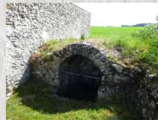
Cormeaux : La Chapelle- Moutil

A partir de la Ferté-Gaucher, remontez le cours du Grand-Morin en parcourant ses coteaux. Cormeaux demeure un haut lieu de pêche sur la rivière, grâce à ses eaux limpides et rapides abritant de nombreux poissons comme la truite fario.