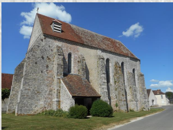
L'Église de Cerneux

Le diamant de Sancy : Sancy les Provins est l'ancienne seigneurie de Nicolas Harlay de Sancy (1546-1629), acquéreur du diamant de Sancy, d'une taille de 52 carats. Au service du roi Henri III en 1589, il s'offre une armée de mercenaires suisses, grâce à la vente du fameux diamant aux anglais. Il mène campagne en Savoie pour le roi, qui n'a rien déboursé. C'est ainsi qu'il conquiert le pays de Gex en Suisse, il sera rattaché à la France en 1601.