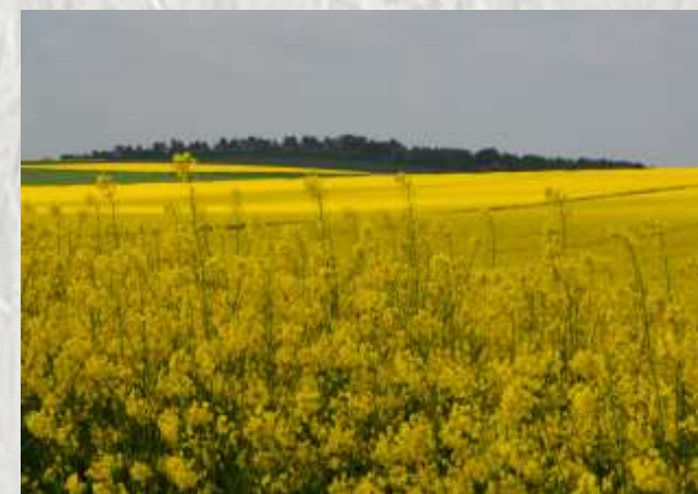
La butte Queue-Chat

Encore un site méconnu de Seine-et-Marne et pourtant que de découvertes au long de ce parcours : les églises de Villenauxe et de Villuis et, le site de Queue Chat dominant la plaine et habité depuis la Préhistoire.