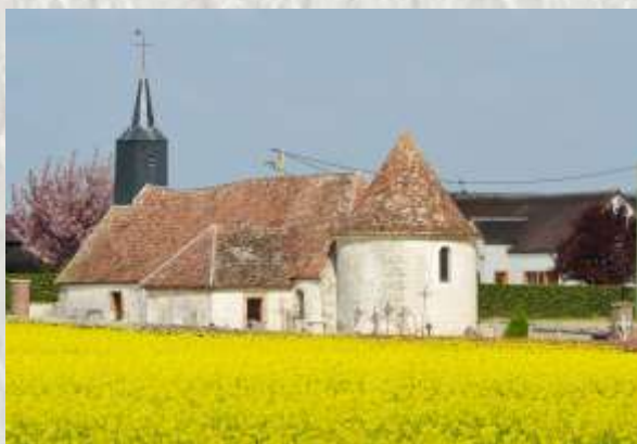
Baby église mausolée

Le site Queue Chat , point culminant de la commune (140 m), a été occupé de la préhistoire à la période gallo-romaine. On y a trouvé un enclos de 140 m de diamètre entouré par 3 fossés concentriques qui devaient délimiter le village jusqu'au Haut Moyen-Age, comme semble l'indiquer les traces de palissades en bois retrouvées dans l'un de ces fossés.