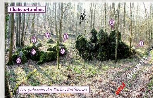
Les polissoirs de Montuffé

Curiosité : ce qui retient l'attention, l'intérêt. Les multiples sites et monuments qui jalonnent cette agréable randonnée répondent au mieux à cette définition. Ils sont de toutes les périodes, du néolithique au moyen-âge, et de la renaissance au 19e s.. Vous les découvrirez ainsi dans la ville de Château-Landon comme dans sa proche campagne.