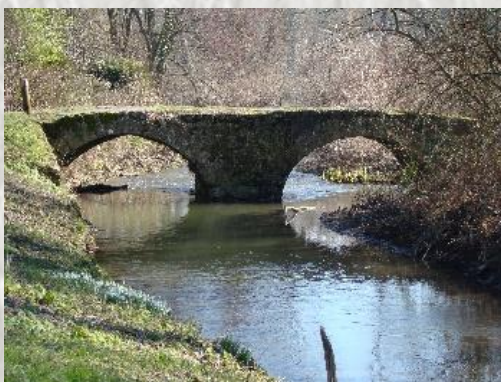
Le pont de Pontfrault

Situé à 150m à gauche du parcours à l'entrée de Pont Franc et en face de l'ancienne léproserie (D) - ex-abbaye de Pontfrault-, ce pont sorti des arbres dont les arches enjambent le bras principal du Fusain date probablement du XIème siècle.