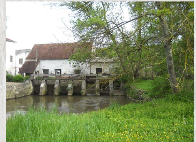
Bellot : la vallée du Petit Morin

Traverser des paysages aux allures de bocage normand, et découvrez l'église de Bellot avec son porche de style Renaissance, puis celle de Sablonnières avec son clocher en bâtière, du XIIème siècle.