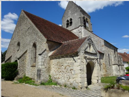
Bellot : l'église

Cette petite rivière, serpentant entre coteaux boisés et prairies, offre un cadre bucolique propice tant à la randonnée qu'à la descente en kayak et canoë. La qualité de ces eaux limpides et bien oxygénées a permis son classement en site « Natura 2000 » entre Verdelot et Saint-Cyr-Sur-Morin. Elle abrite deux espèces de poissons spécifiques : le chabot et la lamproie de Planer. Prenez le temps d'observer la faune locale et d'admirer les églises des charmants villages que vous traverserez. Au cours de votre promenade, vous remarquerez quelques-uns des nombreux moulins jadis alimentés par les eaux tumultueuses du Petit-Morin.