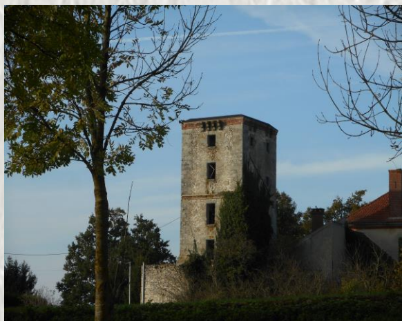
Donjon de l'ancien château de Quincy

La forêt domaniale de Jouy : Située sur deux communes, Chenoise et Jouy le Châtel, c'était l'ancien domaine des Comtes de Champagne, puis de l'abbaye cistercienne de Jouy. Cette forêt est essentiellement plantée de chênes rouvres, pédonculés et de hêtres. Certains de ses chênes sont âgés de plusieurs siècles.