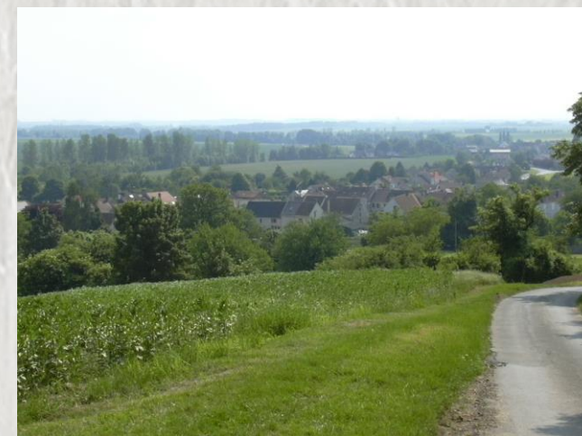
Le village de Doue en Seine-et-Marne (France), vu du sommet de la « Butte de Doue »

Cette randonnée se déroule au sud de Doue en suivant, d'abord le vallon du ru des Avenelles puis, en revenant vers Doue par les champs et le ru de Fosse Rognon.