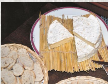
Le Brie de Montereau

Le Brie est un fromage à pâte fermentée, qui se fabriquait autrefois uniquement dans les fermes de la Brie. Il est traditionnellement obtenu avec du lait de vache légèrement écrémé que l'on emprésure. Le lait caillé est placé au séchoir, dans des moules pour l'égouttage. Les fromages déjà fermes sont salés uniformément sur toute leur surface. Au bout de quinze à vingt jours, les fromages recouverts de la moisissure blanche sont descendus en cave où s'achève la maturation. La laiterie de Doue qui fabriquait le Brie de façon traditionnelle a dû fermer ses portes dans les années 90, victime de la concurrence.