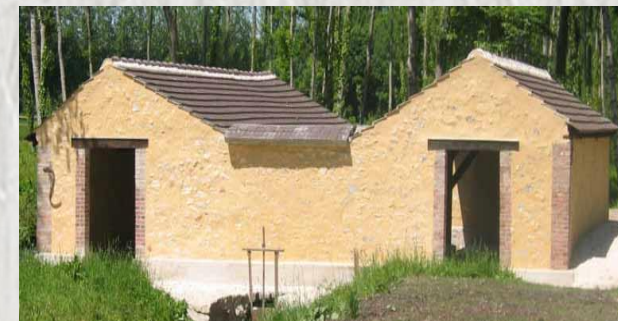
Lavoir à Chalmaison

Une partie du parcours voisine puis longe le ru des Méances. Ce cours d'eau prend sa source entre Provins et Sourdon puis sillonne la Bassée du nord au sud pour se jeter dans la Seine.