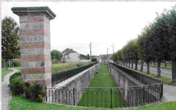
Everly - Saut du Loup