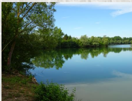
La Bassée

Le lavoir de Chalmaison : ce lavoir communal, construit en 1866 sur les plans de l'architecte Charbaut, est approvisionné par l'eau du ru des Méances.