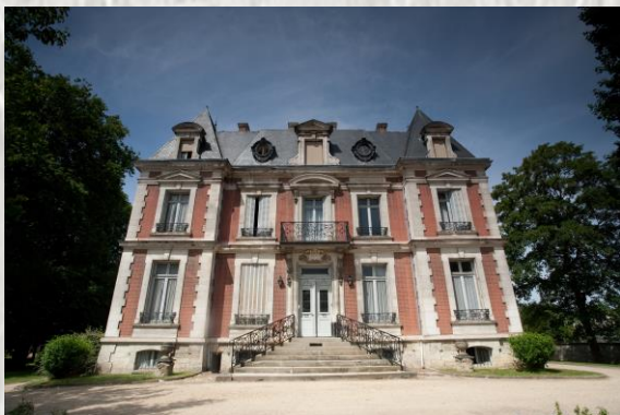
Le Château des Amendes à Montereau

Ulcérés par ce procédé, les ouvriers ne tardent pas à répandre le bruit que ces sommes servent à payer la construction du château de leur directeur. Le surnom de « château des Amendes » est resté.